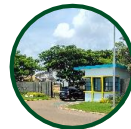
ONE GATE SYSTEM