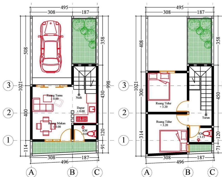
DENAH LANTAI 1