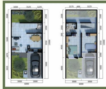
PADMA-B LB. 69 / LT. 78