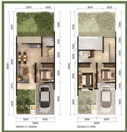
MAHATTARA LB. 80 / LT. 96