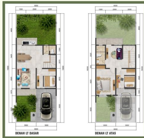
AVANNA LB. 90 / LT. 96