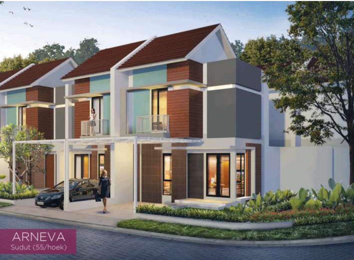
ARNEVA Sudut (55/hoek)